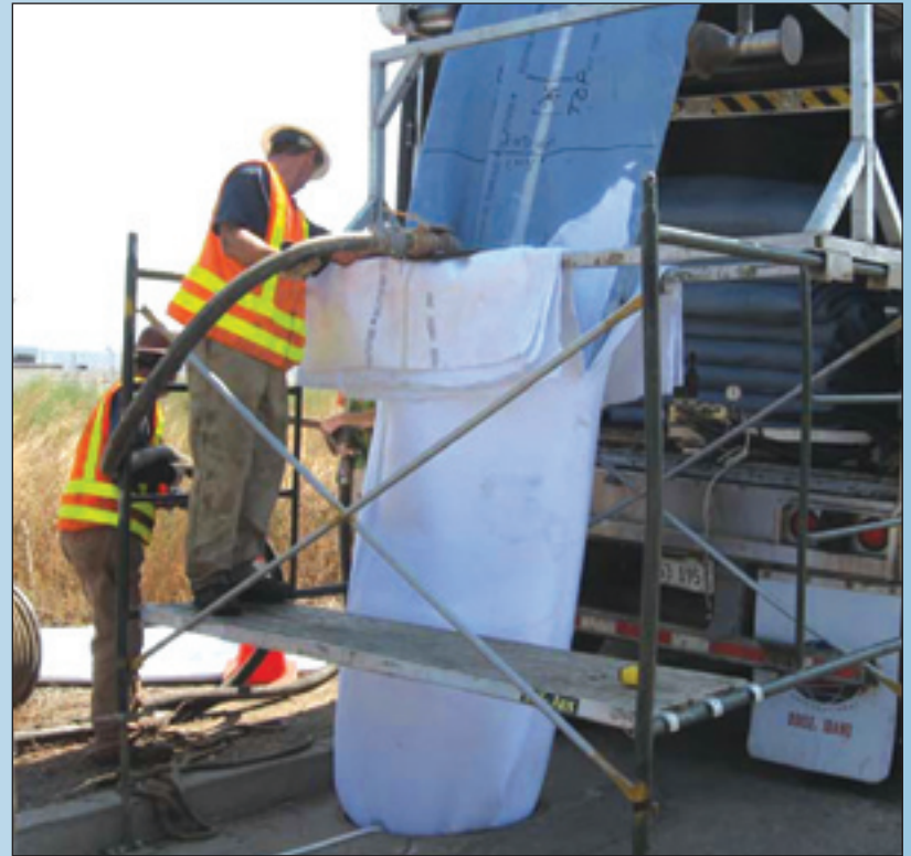
Operarios invirtiendo una tubería de revestimiento de 36" (90 cm) de diámetro desde camión refrigerante

A partir de evaluar el impacto en la comunidad, el costo de construcción y la probada tecnología de restauración de alcantarillado, se decidió restituir por completo un tramo de 8 millas (12 km) con tuberías de curado "in situ" (CIPP, en inglés). Esta opción restaurará toda la estructura como si fuese un conducto nuevo. La instalación de tuberías CIPP afecta menos a las carreteras y propiedades privadas. Es un método de construcción más seguro, más económico y más rápido que los métodos tradicionales de excavación y sustitución.