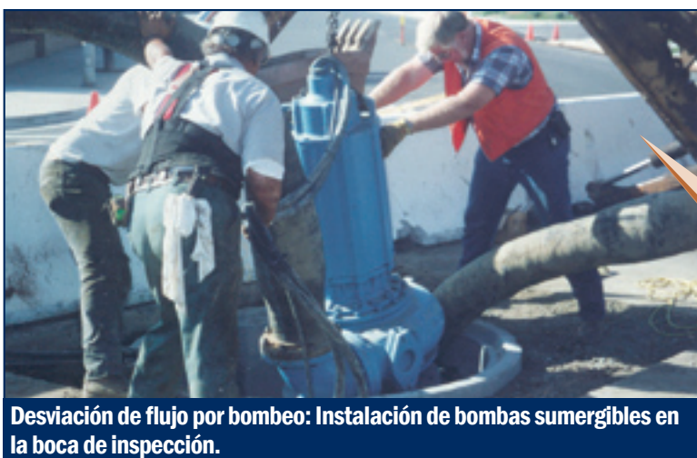
Desviación de flujo por bombeo: Instalación de bombas sumergibles en la boca de inspección.