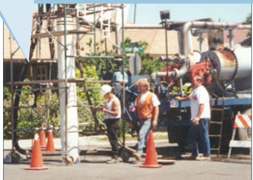
Curado o endurecimiento de la tubería de revestimiento a través de circulación de agua caliente.

de las bocas de inspección existentes y no requiere demasiada excavación. Luego de desviar todo el flujo de la alcantarilla, se quita temporalmente la cubierta de la boca de inspección. El revestimiento de CIPP se introduce en el conducto desde la boca de inspección mediante presión de agua. El revestimiento luego se cura con agua caliente o vapor hasta que se endurezca.