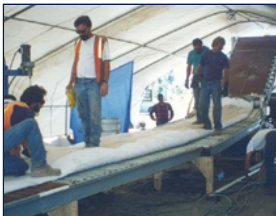
Operarios humedeciendo una tubería de revestimiento con resina dentro de una carpa

Nuestro propósito es restaurar los conductos de alcantarillado de manera rápida y segura;